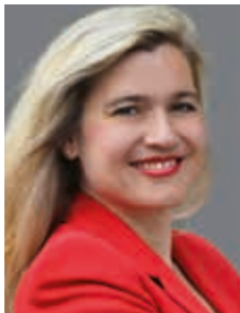
Melanie Huml MdL Bayerische Staatsministerin für Gesundheit und Pflege