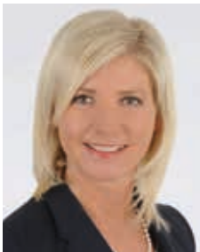
Ulrike Scharf MdL Bayerische Staatsministerin für Umwelt und Verbraucherschutz

Wir laden Sie herzlich ein, sich über die Thematik Klimawandel und Gesundheit sowie das gleichnamige Verbundprojekt zu informieren und darüber zu diskutieren.