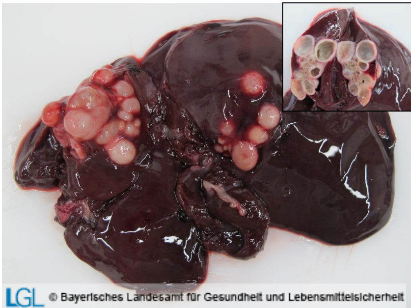
Abb. 4: Leber eines Bibers mit zahlreichen unregelmäßig in die Umgebung wachsenden, kugeligen, zum Teil konfluierenden Gebilden; kleines Bild: Herde eröffnet, mehrfach gekammerte Struktur erkennbar

Echinokokken beim Biber sind ebenfalls im Lebergewebe zu finden. Es handelt sich dabei um infiltrativ wachsende und damit unscharf abgegrenzte Gebilde, bestehend aus zahlreichen kugeligen, zum Teil bis über einen cm großen Herden; auf der Schnittfläche ist in der Regel ein mehrfach gekammertes Gebilde zu erkennen (Abb. 4). Feingeweblich weisen diese Strukturen im Unterschied zum Wildschwein neben den für Echinokokken typischen dicken azellulären Lamellen auch Keimschichten mit zahlreichen vermehrungsfähigen Kopfanlagen auf. Somit können sich die Echinokokkenfinnen beim Biber wie in anderen Nagetieren, die als natürliche Zwischenwirte dienen, zu infektionsfähigen Finnen entwickeln, die durch orale Aufnahme zu einem Fuchsbandwurmbefall im Endwirt führen können.