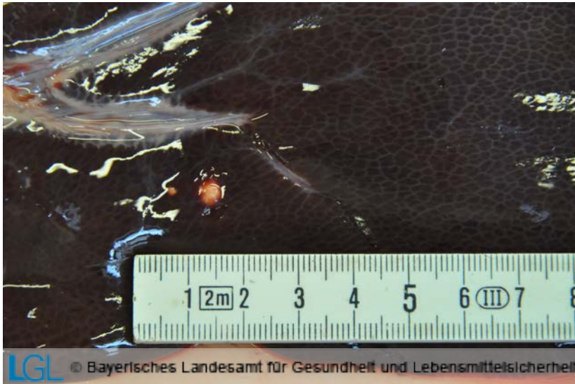
Abb. 1: Wildschweinleber mit zwei kleinen Fuchsbandwurmknötchen