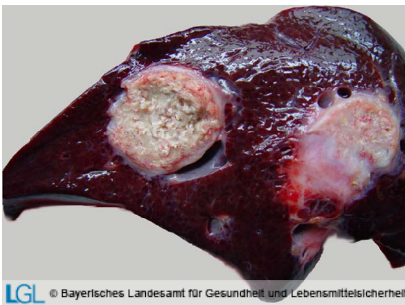
Abb. 3: Wildschweinleber mit einzelnen großen Fuchsbandwurmknötchen, von einer Bindegewebsmembran umgeben, auf der Schnittfläche gekammert und verkalkt